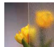
DeKa Orna 504